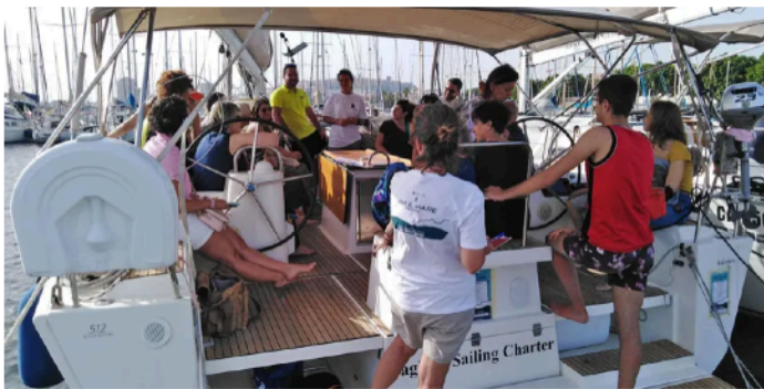
Vivi il Mare 2022, laboratorio nodi