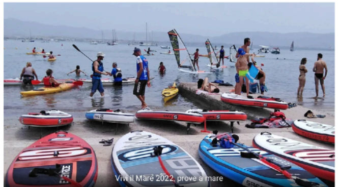
Vivi il Mare 2022, prove a mare

Oltre alle derive a vela, windsurf, kayak e sup, quest'anno sarà possibile provare la wing, recentissima specialità che riscuote sempre più successo, e l'apnea, grazie alla collaborazione con la Blue Tribune. Le attività saranno aperte a tutti, a partire dai 6 anni di età, a seguito di prenotazione sul sito dell'associazione ( arcipelaghiasd.com ) e gratuite per la prima prova. Anche quest'anno, avranno accesso privilegiato alle attività i bambini delle case-famiglia gestite dalla Fondazione Domus De Luna Onlus. Inoltre, nei pomeriggi, dalle ore 16:00 a Su Siccù, sarà possibile una prova con istruttore, dai 14 in su, sul J70 del Vela Club Cagliari.